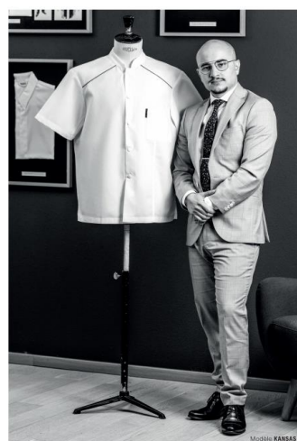
Jordan | Commercial BRAGARD®