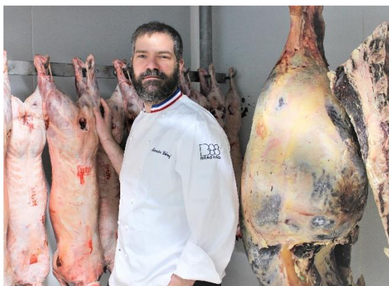
Romain Leboeuf ©Bragard